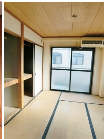
リフォーム前の写真です。