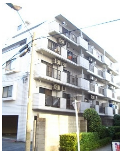
反転タイプの別のお部屋の写真です。

広々・とてもキレイな室内です！ 敷地内に駐車場及びバイク置場有り！ 事務所使用可能です！スーパー、コンビニ至近！