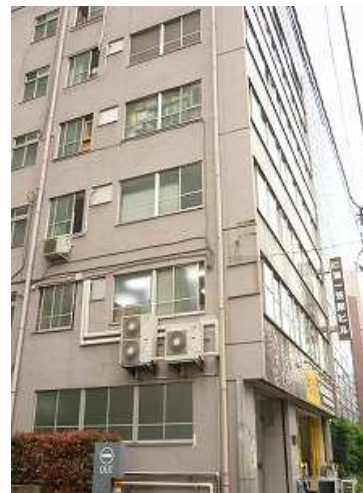
貸会議室の写真です