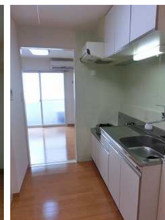
↑リフォーム前の写真です

設備 電気・ガス・水道・給湯機・エアコン・バス・トイレ・BS/CS・洗濯機置き場・2重サッシ